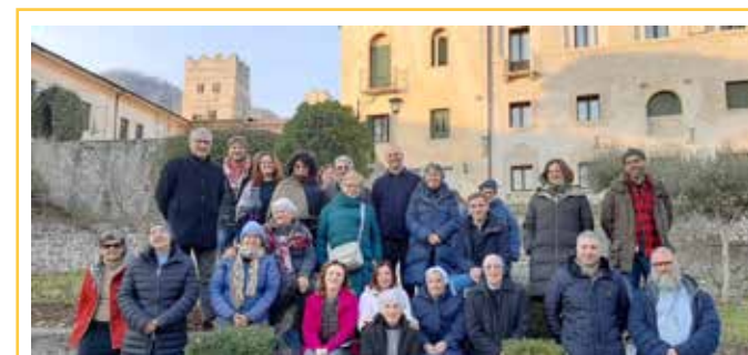
Esercizi Natale 2023

Piccola Apostola della Carità, guida di esercizi spirituali ignaziani e accompagnatrice spirituale.